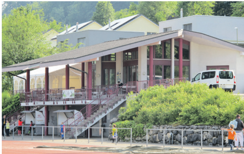
Das 25-jährige Klubhaus Tannenbrunn soll renoviert werden.

Das Eigenkapital erhöhte sich aber im Jahr 2014 um beinahe 9,9 Millionen Franken und beläuft sich nun auf 42,3 Millionen Franken. Wie kam es dazu? Im Rahmen des neuen Rechnungslegungsmodells HRM2 musste die Gemeinde sämtliche Vermögenswerte im Finanzvermögen (Baulandreserven, Liegenschaften, welche nicht im Verwaltungsvermögen sind) neu bewerten. Da diese Immobilien in den letzten Jahren bereits abgeschrieben waren, erfuhren sie einen Aufwertungsgewinn in der Höhe von rund 11,1 Millionen Franken. Sissach ist also praktisch über Nacht um den entsprechenden Betrag «reicher» geworden. Selbstverständlich handelt es sich lediglich um einen Buchgewinn.