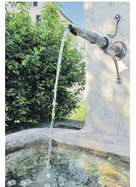
Wasser ist lebenswichtig.

Der Gemeinderat hat die Zeichen der Zeit erkannt und sich entschieden, die Internetseite der Gemeinde Sissach zu erneuern. Mit der Umsetzung der neuen Seite dürfte dann auch das eine oder andere Geschäft ohne einen Besuch auf der